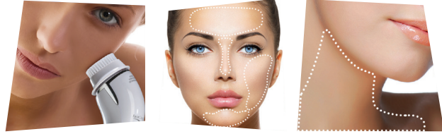
ARZUM BELLİSSIMA FACECLEANSİNG PRO CİLT BAKIM SETİ

Kadın erkek demeden sağlıklı ve ışıltılı bir cilt hepimizin hayalidir. Bunun için de ilk kural temizlik... Arzum'un kişisel bakım kategorisinde geliştirdiği yeni ürünü Arzum Bellissima FaceCleansing Pro Sonic Cilt Bakım Seti, özel tasarlanmış üçgen başlıkları sayesinde yüzün en kıvrımlı bölgelerine rahatlıkla ulaşıyor ve sonic titreşim teknolojisi sayesinde elle temizlemeye göre 7 kat daha etkili çözüm sunuyor. Yüz temizleme, peeling ve mikro masaj başlıkları ile cilt bakımında uygulanan tüm özellikleri tek bir cihazda topluyor. Zaman ayarı ile yüzün her bir bölgesinde etkin cilt bakımı için uygun görülen süre dolduğunda cihaz sesli uyarı vererek 80 saniye sonra otomatik olarak kapanıyor. Ayrıca su geçirmez özelliği ile duşta da rahatça kullanım sağlıyor.